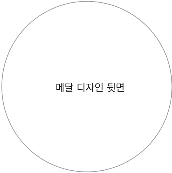
메달 디자인 뒷면