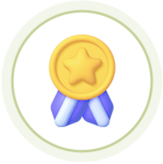
인성 인증 면접 뱃지