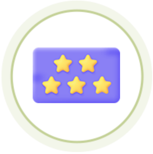
굿네이버스 채용 가산점