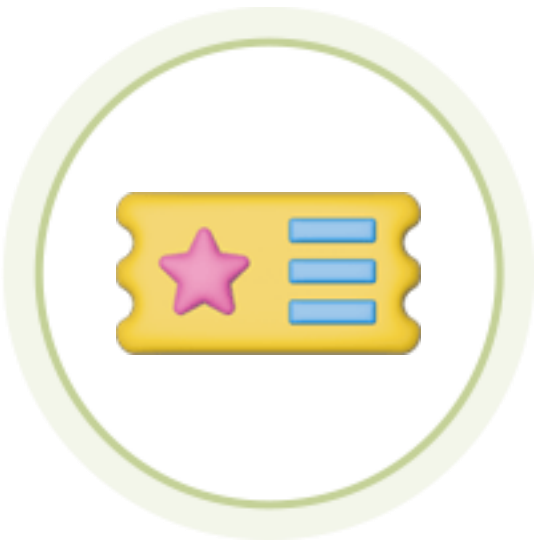
자기개발학습 콘텐츠 이용권