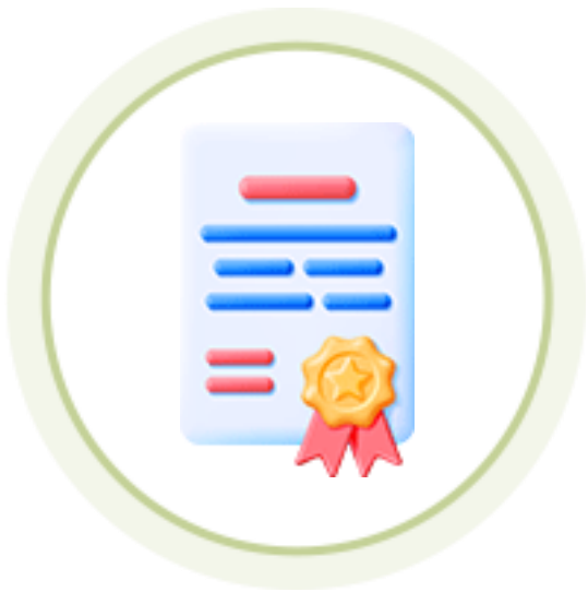
인성역량 강화과정 자격요건